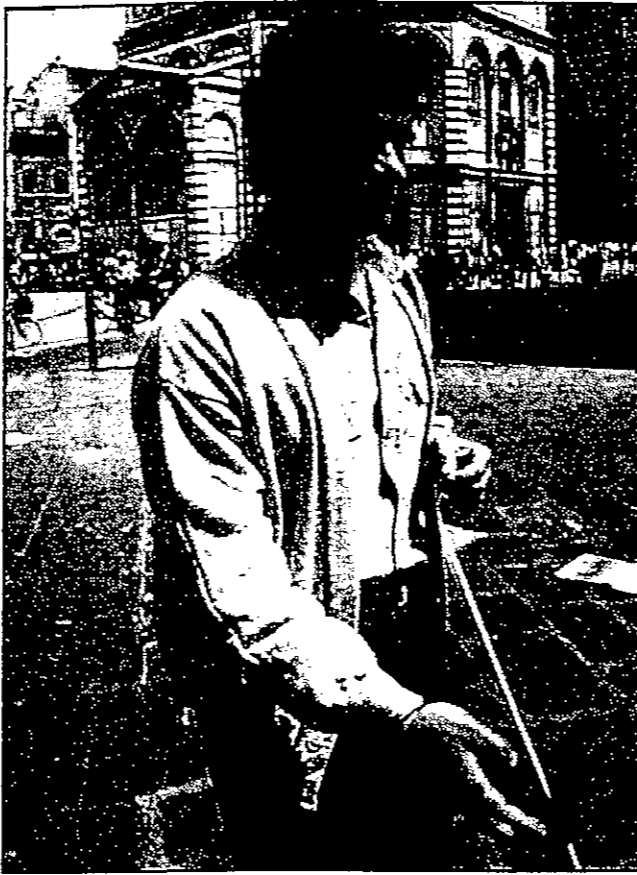
العصا البيضاء رمز استقلالية الكفيف واعتماده على نفسه